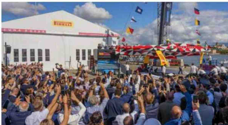
Tre momenti del varo di Luna rossa a Cagliari