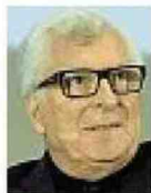
Patrizio Bertelli Ad di Prada

Il camouflage nasce per confondere le linee e depistare il nemico, lo usavano le navi da guerra