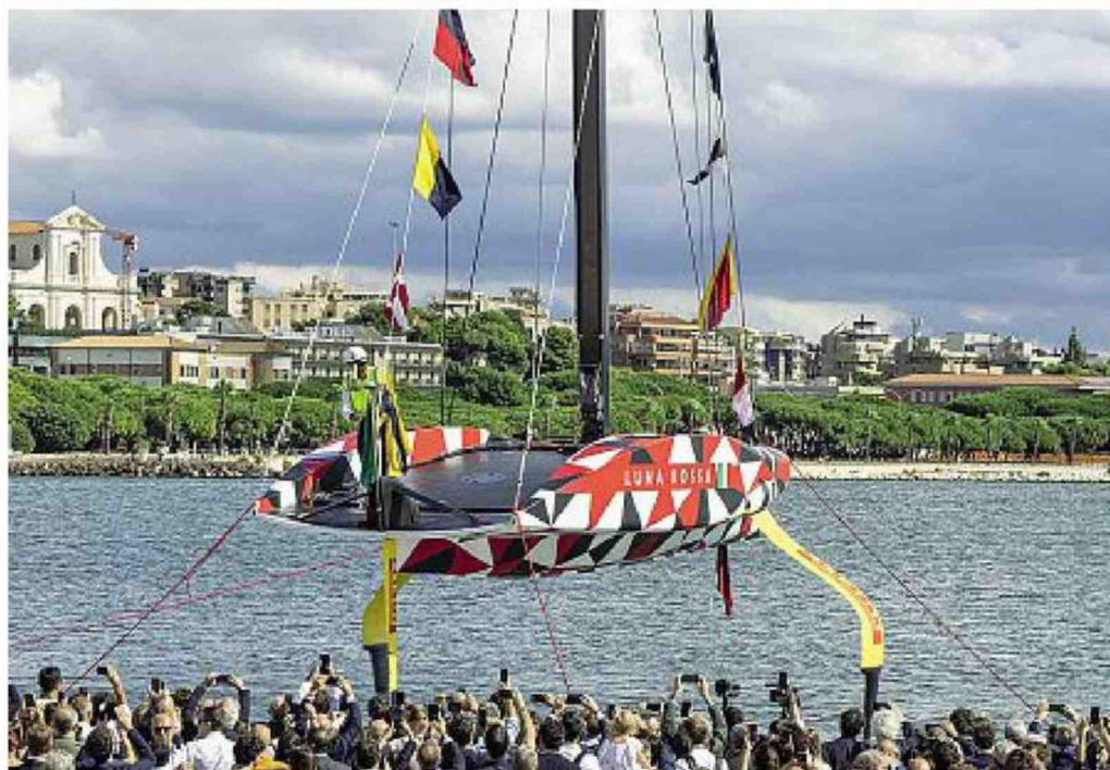
Bagno di folla Nella base di Cagliari è stato svelato e varato il prototipo di Luna Rossa per la preparazione alla America's Cup 2024