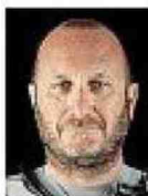
Max Sirena, Skipper Luna Rossa

Nel team di Sirena entrano anche l'oro di Tokyo Tita e il bronzo del canottaggio Rosetti