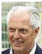
Marco Tronchetti Provera Ceo Pirelli

Tradizione, tecnologia e passione: la nuova barca e l'equipaggio hanno tutto per farci emozionare